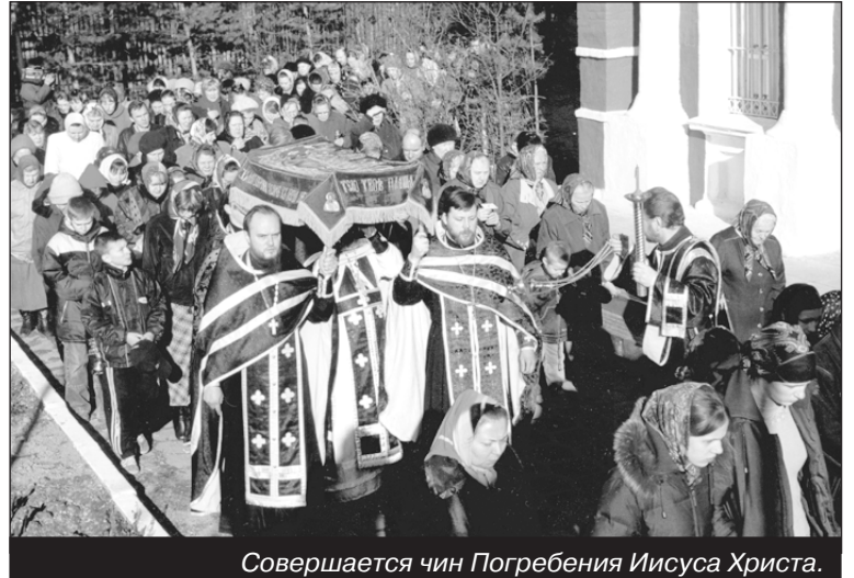
Совершается чин Погребения Иисуса Христа.

На встречу с учителями-победителями конкурса прибыли Губернатор Московской области Борис Всеволодович Громов, Председатель Московской областной думы, Министр образования Московской области, Главы Администраций городов и районов Московской области. В числе приглашенных присутствовал и благочинный церкви Пушкинского округа протоиерей Иоанн Монаршек, который тепло поздравил Б. В. Громова с Праздником Пасхи, и вручил ему памятный подарок — Пасхальное Яйцо.