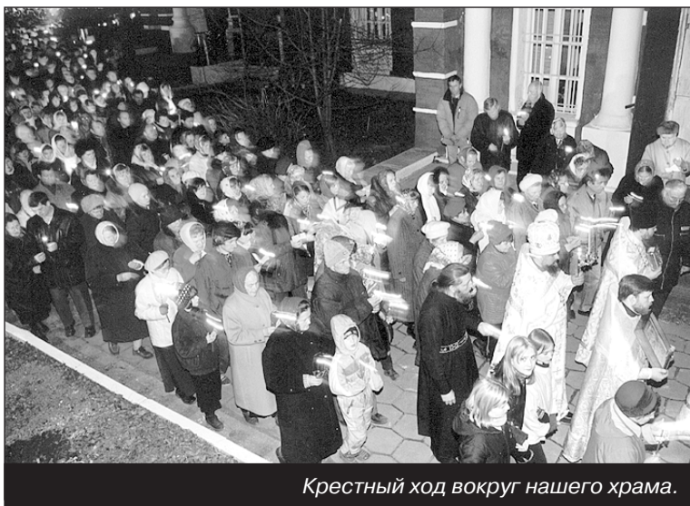
Крестный ход вокруг нашего храма.

ряды прихожан с затаенным дыханием ожидают начала Таинства. Волнообразно зажигаются свечи. От их теплого мерцания светятся лики Спасителя, Богородицы и всех Святых. На лицах верующих надежда и мольбы о прощении, покаянии, исцелении. «Господи, прости мя грешного! Господи,