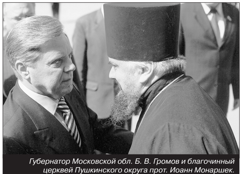
Губернатор Московской обл. Б. В. Громов и благочинный церкви Пушкинского округа прот. Иоанн Монаршек.

Проезд электропоездом с Курского вокзала г. Москвы. Ориентировочное время в пути — два часа.