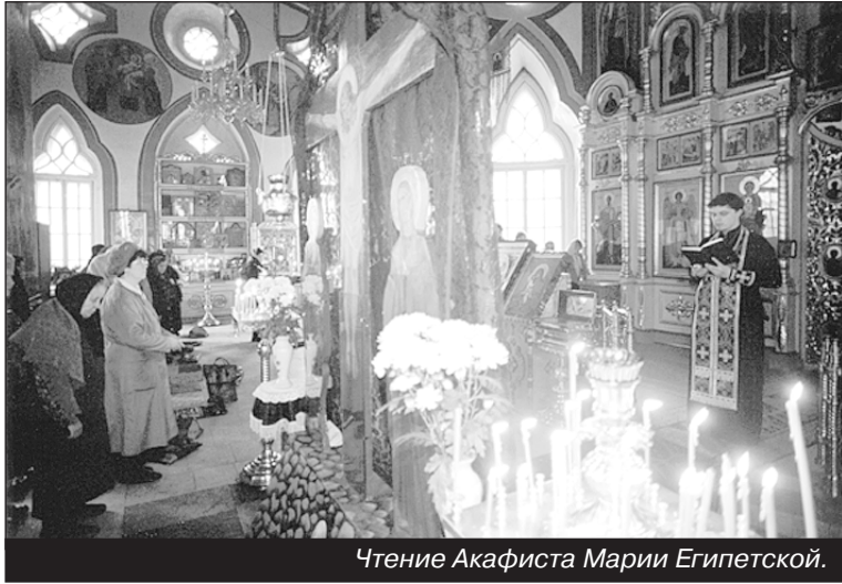
Чтение Акафиста Марии Египетской.

8 апреля 2003 года в г. Москве в Успенском храме Новодевичьего монастыря прошло награждение клириков Московской Епархии. Его Святейшеством, Святейшим Патриархом Московским и всея Руси Алексием II за усердное служение церкви Христовой к Праз-