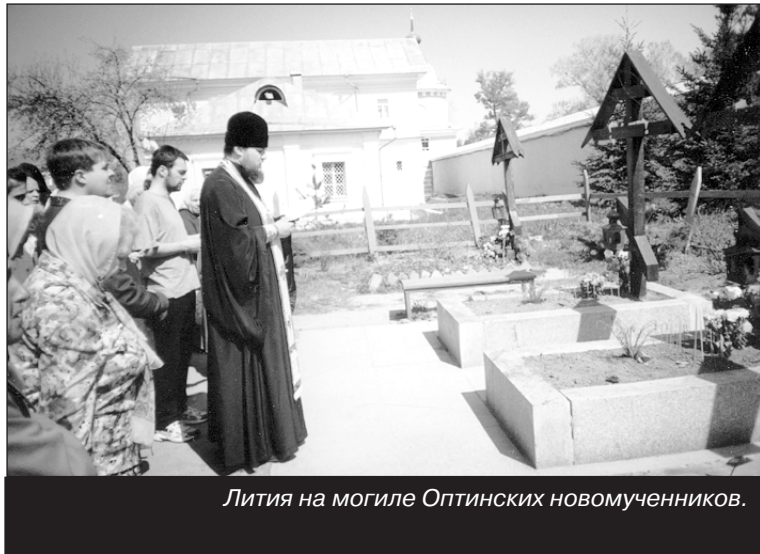
Лития на могиле Оптинских новомучеников.

А ведь самое главное — самому найти свой верный путь, начать с себя, со своей личности. Если вы этого не определите,