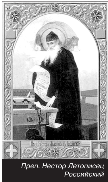
Преп. Нестор Летописец Российский