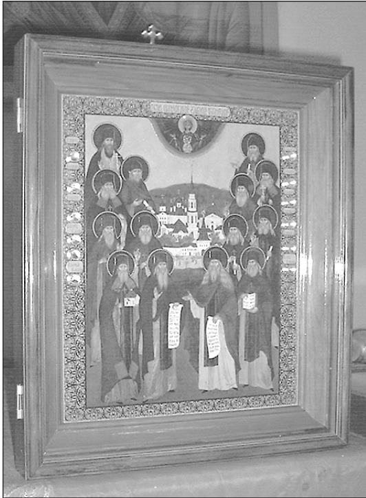
(Окончание. Начало на 1 стр.)