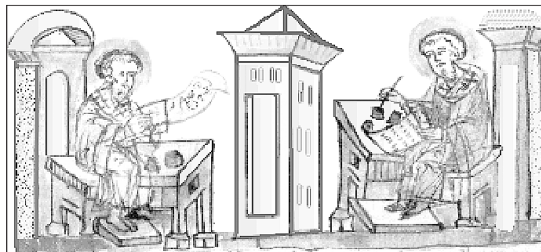
Св. Кирилл и Мефодий создают славянскую Азбуку

С праздником Славянской письменности! Св. братья-просветители — Кирилл и Мефодий — молитесь Богу о нас!..