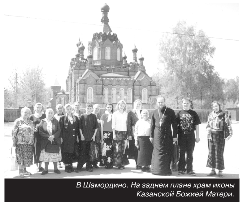
В Шамордино. На заднем плане храм иконы Казанской Божией Матери.

Подготовлено издательским центром храма иконы Смоленской Божией Матери г. Ивантеевка. Тел. (8-253) 6-12-54.